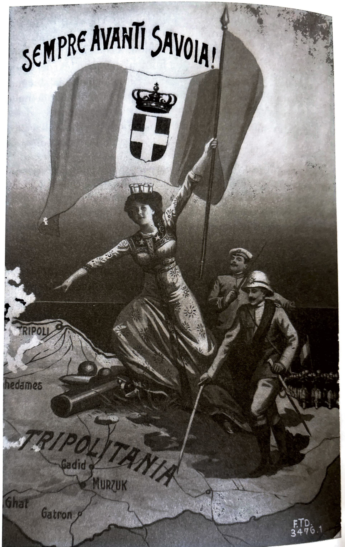
Fig. 30. Cartolina illustrata del 1912. L'Italia sabauda che addita nella Libia la terra di conquista ai suoi soldati.